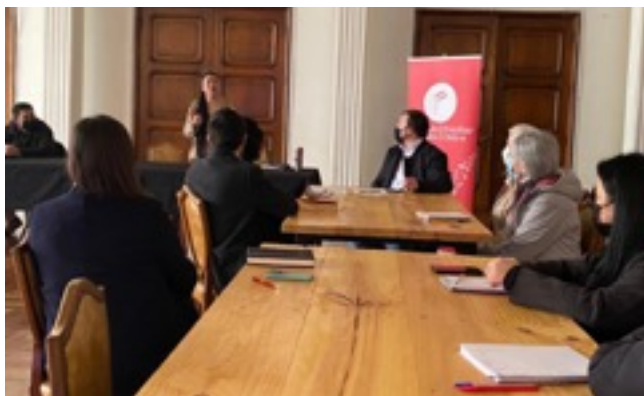
Capacitación dictada por CCSMF en Osorno