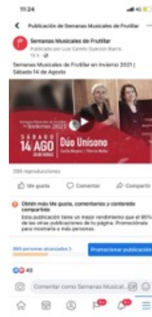
Publicación RRSS SMF en Invierno