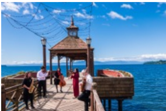
Toma de fotos afiche 54