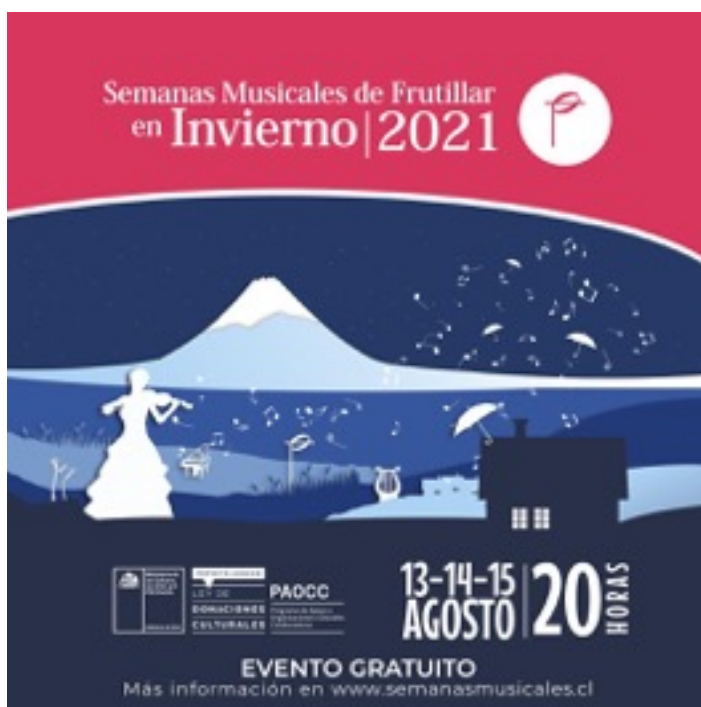
Afiche Semanas Musicales en Invierno