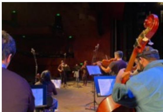
Ensamble de Solistas de la Orquesta