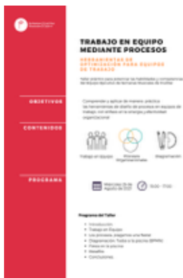
Capacitación Equipo Ejecutivo